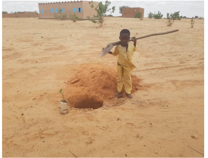
Garçon prêt à planter