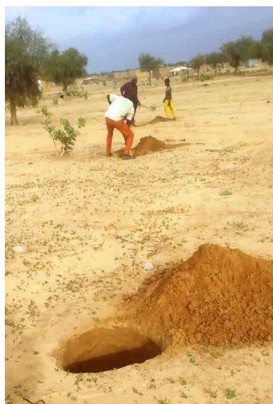
Préparation des plantations : creusement et alignement des trous