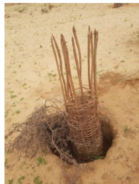
Protection des plants