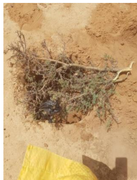
Plant protégé provisoirement