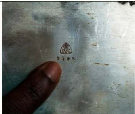
plateau en bronze datant de 1957