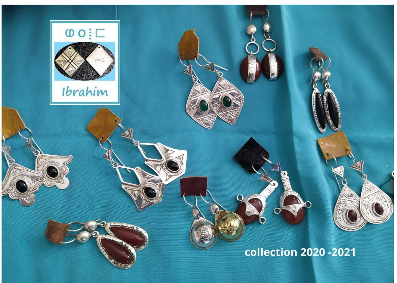
collection 2020 -2021