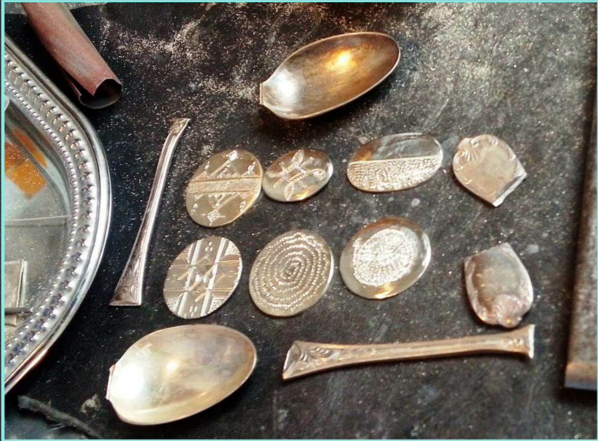
bijoux confectionnés en laiton et argent - nettoyage au citron