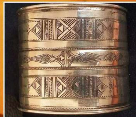
bracelet double "autoroute" 75 €