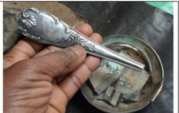
Cuillère en argent de 1930

Afin de sauver la culture de mes ancêtres, j'ai pensé à sauvegarder le passé de la cuillère et du plateau, souvenirs de chaque famille dans le monde entier. Toujours je pense aux passages de la cuillère dans la bouche matin, midi et soir et le plateau est l'assistant permanent de la cuillère. Pourquoi oublier ça ?