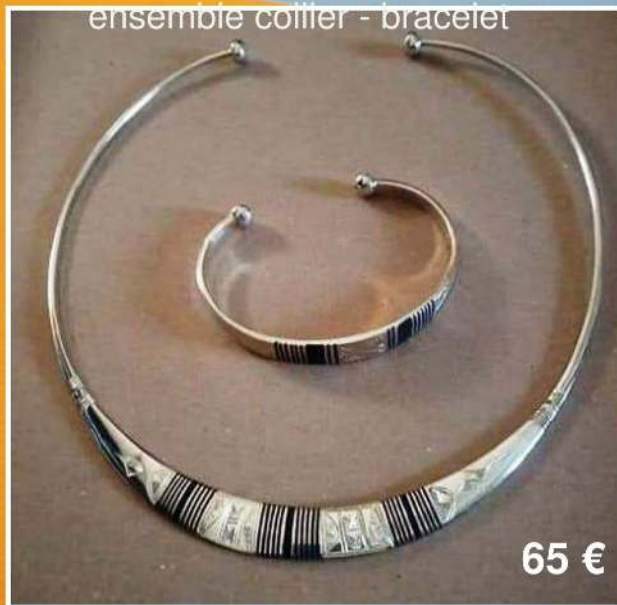
ensemble coiffier - bracelet